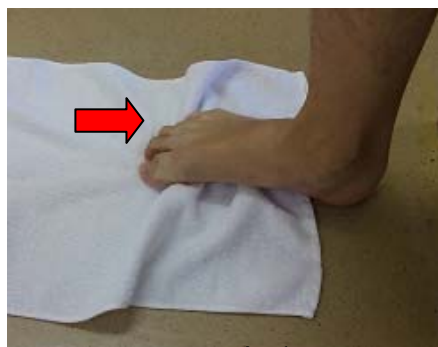
足指でタオルを手繰っていく