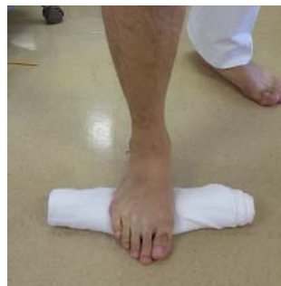
土踏まずにタオルを入れて踏み潰す (足指と同じ方向に膝を曲げて行います)

※ 痛みが出た時はまずは安静(アイシング)にして下さい。 近くの病院・診療所に診てもらう事をお勧めします。