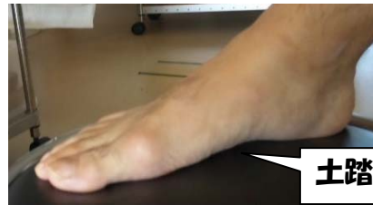
土踏ま ぶ ずが少ない・・・

：足の土踏ま ぶ ずが低下・消失した状態 ⇒ 足底の疲労感や固さ、足首や足周辺の痛みが生じやすい！