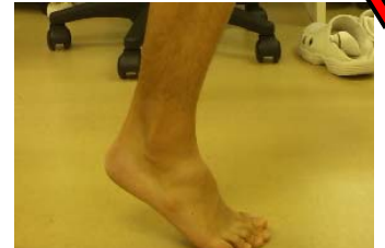
あなたはできますか？