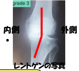
レントゲンの写真